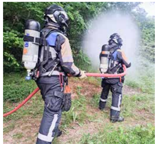
Übung Pfadiheim Chelli